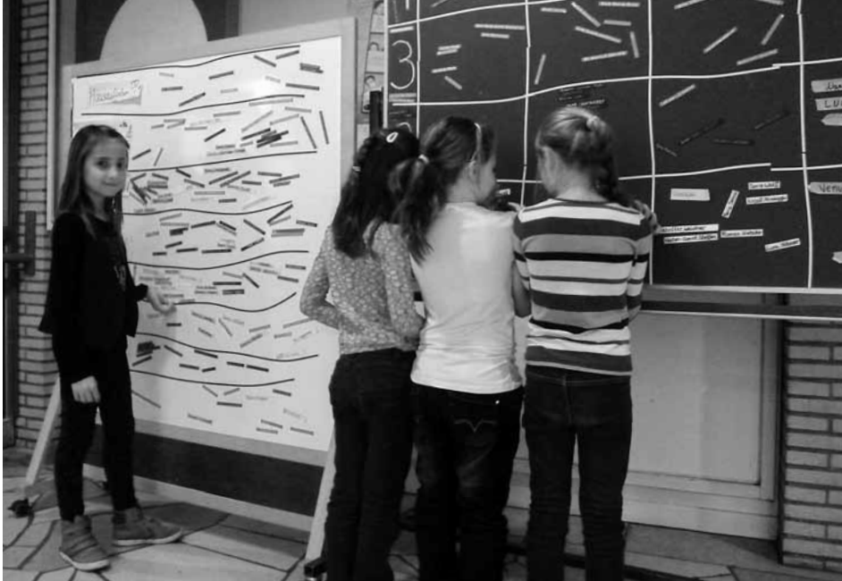
Von hier aus wird alles koordiniert.