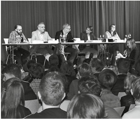
Wahlkampfpodium im Wichern-Forum

■ Unsere Schülerinnen und Schüler der gymnasialen Oberstufe hatten die Veranstaltung mit Hamburger Spitzenpolitikern geplant und vorbereitet. Und so wurde es ein sehr kurzweiliger Abend vor knapp 200 Gästen, bei dem sich die Eingeladenen ganz menschlich präsentierten.