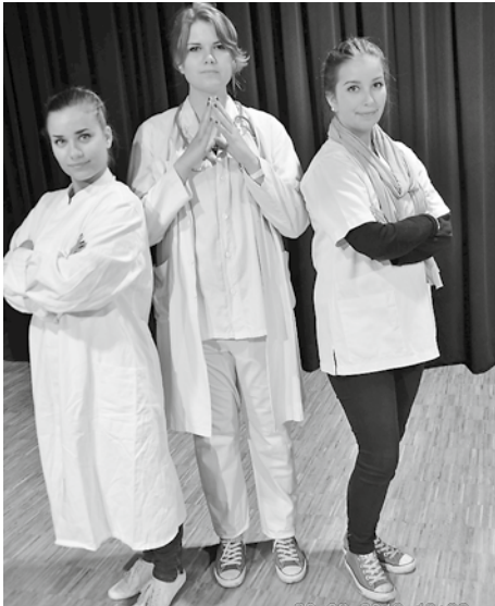
Wir versprechen einen unterhaltsamen Abend!