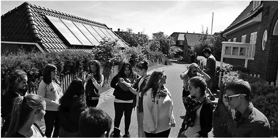
Haus Amrum ist eine Reise wert!