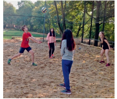
Schüler beim Eröffnungs-Match