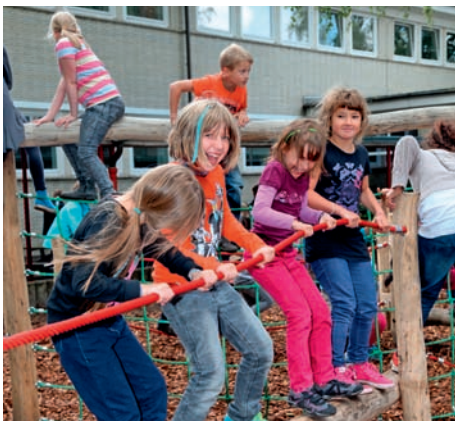
Pausenspaß mit Hand und Fuß

■ Zu Beginn des Schuljahres erwartete die Grundschüler auf ihrem Pausenhof eine Überraschung: In den Sommerferien war die alte, defekte „Kletterspinne“ durch ein neues