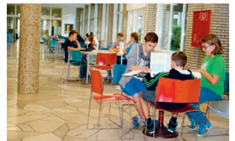
Bessere Atmosphäre zum Lernen und Chillen

Das Motto „Die Schulstraße als Heimathafen“ wird später im Gesamtbereich der Schulstraße neben den blau gestrichenen Heizkörpern auch durch weitere Gestaltungselemente, darunter als Leuchttürme umgewandelte Säulen und Mosaik mit Meeres- und Schiffsmotiven wirksam. Mit Hilfe der engagierten AG „Lebensraum Schule“ von Eltern und Lehrern wird die Neugestaltung der Schulstraße in den Sommerferien 2015 abgeschlossen. CE