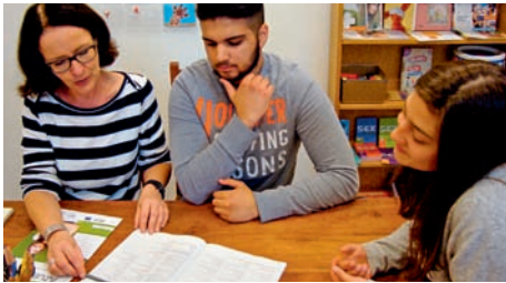
Individuelle Beratung und Planung

■ Im vergangenen Schuljahr ist die Stadtteilschule mit einem neuen Modell für die Jahrgänge 9 und 10 an den Start gegangen. Die beiden Abschlussjahrgänge sind konzeptionell auf die möglichen Schulabschlüsse: den Ersten Allgemeinbildenden Schulabschluss (ESA), Mittleren Schulabschluss (MSA), Abitur nach 9 Jahren ausgerichtet worden.