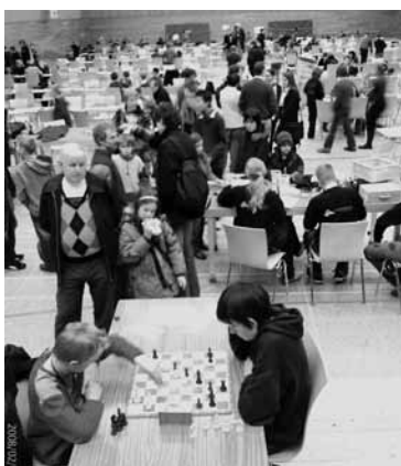
Diese Konzentration ist schon beeindruckend!

Allein die Wichern-Schule stellte 6 Teams, in denen Schüler und Schülerinnen aus allen drei Schulformen vertreten waren – unsere Jüngsten stammten aus der 2. Klasse. Das erfolgreichste Wichern-