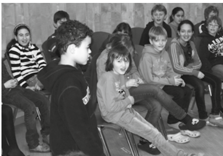
Beim Casting im Andachtsraum

■ Ein altherwürdiges englisches Schloss muss von der aristokratischen, aber leider verarmten Familie Canterville verkauft wer-