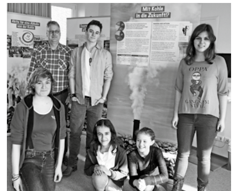
Schüler besuchen die Ausstellung während des Unterrichts.

Na klar, lieber mit Kohle in die Zukunft als ohne Kohle. Den leidigen Zaster braucht man schon irgendwie. Und mit Kohle kann man Kohle machen. Das zeigen uns derzeit die energiewendegewendeten Akteure in unserer Republik. Dass die hier verheizte Kohle zu 80 % aus dem Ausland stammt, wissen nur Wenige. Auf die Probleme der Importkohle aus Südafrika macht die aktuelle Ausstellung des KOSA e.V. im Leseturm aufmerksam.