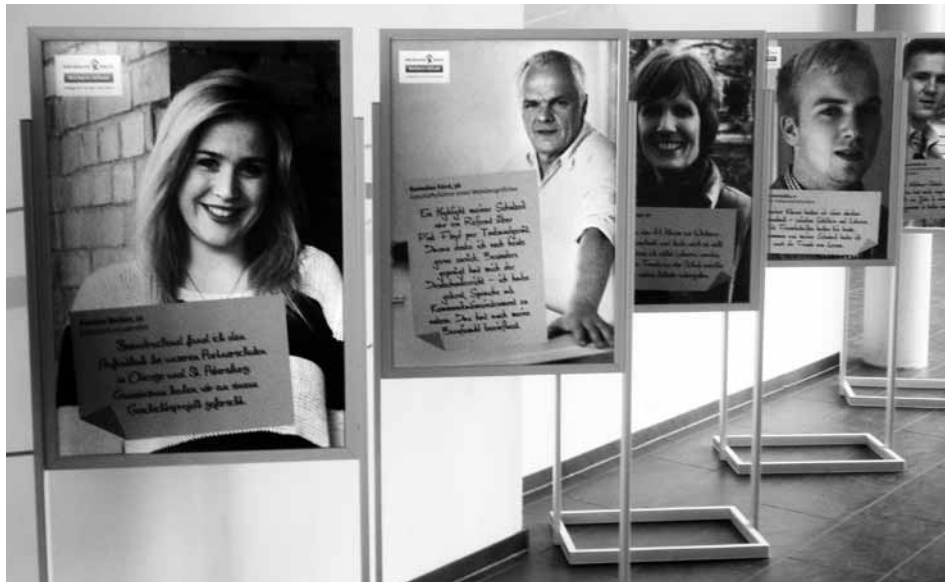
Die komplette Ehemaligengalerie findet sich auf unserer Homepage .